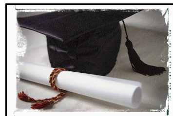
Indirizzo Commerciale, Alberghiero e di Ricezione Turistica

L'indirizzo "Servizi Commerciali, Alberghieri e di Ricezione Turistica" ha lo scopo di far acquisire allo studente, a conclusione del percorso quinquennale, le competenze professionali che gli consentono di supportare operativamente le aziende del settore turistico alberghiero, oltreché quelle commerciali e di gestione dei processi amministrativi. In tali competenze rientrano anche quelle riguardanti la promozione dell'immagine aziendale attraverso l'utilizzo delle diverse tipologie di strumenti di comunicazione, compresi quelli grafici e pubblicitari.