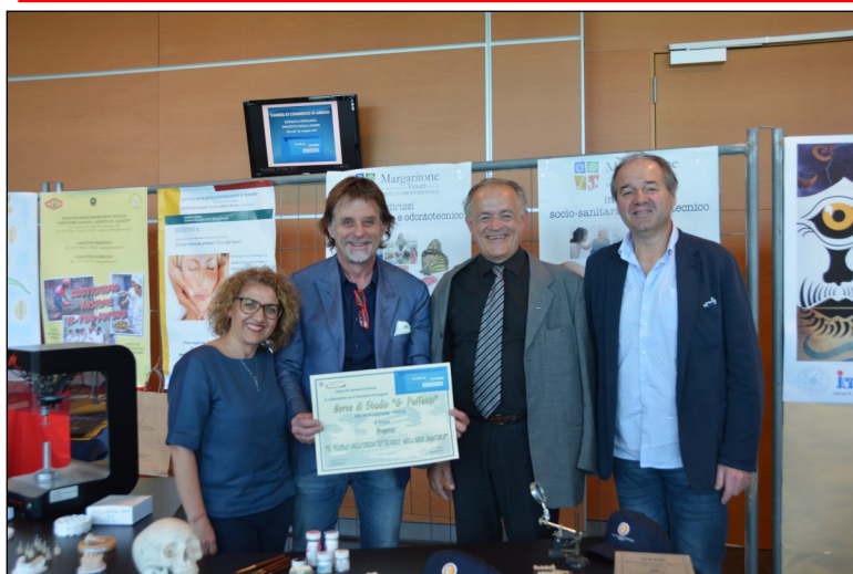
L'Istituto Vasari premiato alla Camera di Commercio di Arezzo

Lo studente Diplomato in Servizi Commerciali, Alberghieri e di ricezione Turistica ha competenze professionali che gli consentono di inserirsi nelle aziende a livello amministrativo, di ricezione alberghiera, di organizzare viaggi, eventi e percorsi turistici. Lo studente impara come offrire i servizi di accoglienza in Hotels, Camping, Villaggi vacanze, Tour Operators , come promuovere le vendite e l'immagine delle aziende attraverso l'utilizzo dei diversi strumenti di comunicazione e dei mass media..